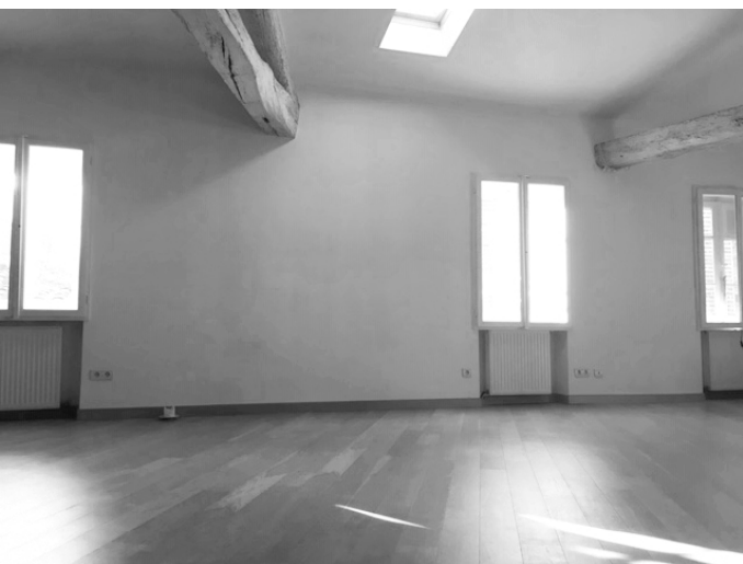
IVORY TOWER STUDIO (45m 2 )